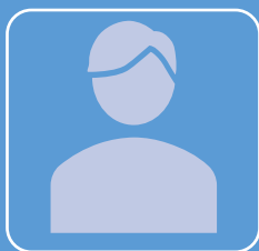
K 様 男性

自動車保険3台の満期更新にあたり、保険料の大幅な上昇に不満がありネット保険への移行を考えていたが、担当者が条件などを見直し改めて保険料を精査した結果、保険料が許容できる範囲となり、親切丁寧な説明で非常に理解できたことから、またこちらで契約いただけることになりました。