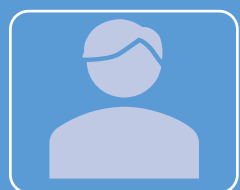
K 様 男性

地震保険の鑑定で保険金が支払われない旨の連絡を受け、担当者のアドバイスで鑑定人が見ていない破損した家財を提示した結果、一部であるが支払認定を受けたことに感謝いただきました。