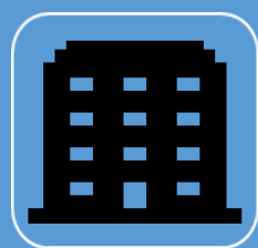
F 社 様

自動車保険3台の満期更新にあたり、保険料の大幅な上昇に不満がありネット保険への移行を考えていたが、担当者が条件などを見直し改めて保険料を精査した結果、保険料が許容できる範囲となり、親切丁寧な説明で非常に理解できたことから、またこちらで契約いただけることになりました。