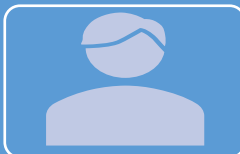
N 様 男性

火災保険料がまた高くなったの？どうにかできないの？との不満が寄せられたが、原材料の高騰、保険金請求金額の高騰、自然災害多発の影響により自動車、火災保険とも保険料が高騰していることを説明、納得いただき、3年一括プランで契約いただきました。